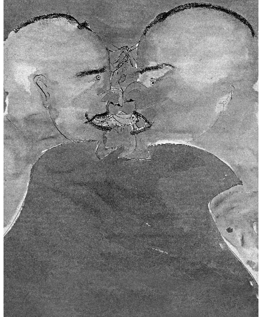
• Portada: Sin título Francisco Toledo, Libreta de apuntes , edición facsimilar. 2003.