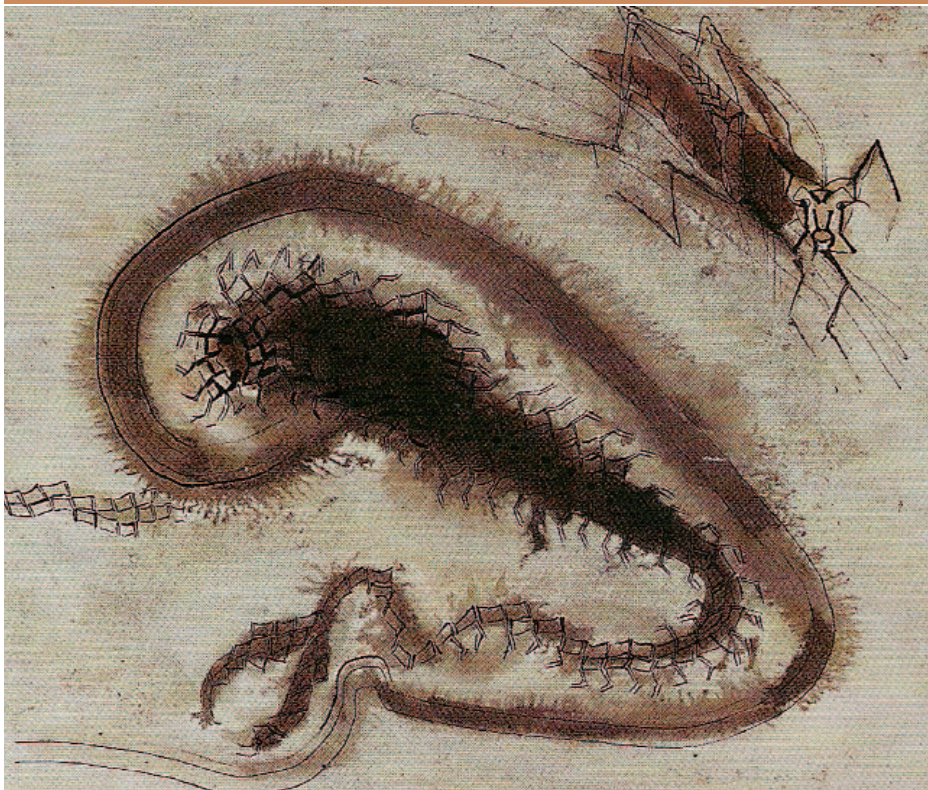
• Imagen: Francisco Toledo , acuarela, Serie Insectario II , 31